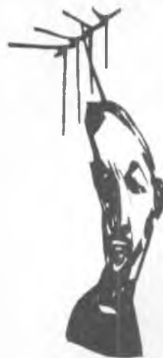
ALAI - (Quito, Ecuador)

Necesitamos, entonces, alianzas entre periodistas, entre organizaciones. Necesitamos estar más conscientes en EE.UU. del trabajo de cine, crítica, medios que se realiza en América Latina. Y necesitamos encontrar la manera de respaldarnos mutuamente y de publicar estos trabajos acá, y viceversa. A nosotros, por ejemplo, nos interesa encontrar algún productor en América Latina que quisiera difundir nuestras producciones en español, si bien sabemos que el tema de derechos humanos por lo general no es bienvenido en la televisión.